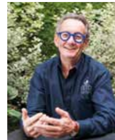
Dr Jean-Paul RINGARD

PROGRAMME Paris : Novotel les halles 75001 - 1 er jour de 10h à 18h30, 2 e jour de 9h à 16h30